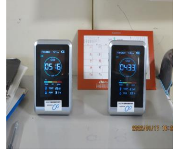
二酸化炭素センサー 2台