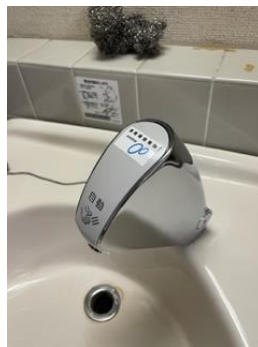
自動水栓整備 6箇所