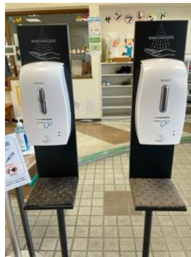
オートディスペンサー 2台