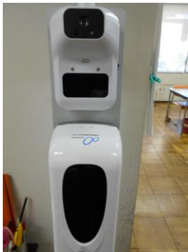
非接触温度計付 オートディスペンサー 1台