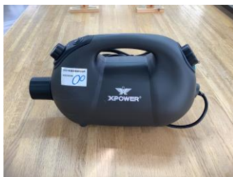
アルコール消毒液噴霧器 1台